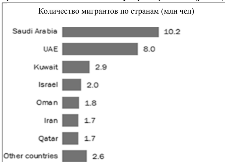
Рис. 1. Количество мигрантов в странах Персидского залива [15]

Саудовская Аравия, равно как ОАЭ, Иордания, Кувейт, Оман и Катар, в начале XXI века характеризуется притоком большого количества трудовых мигрантов, причем не только из слаборазвитых стран региона, но и с территории всей Азии, включая Индию и Китай. По некоторым оценкам, на страны Персидского залива приходится до 40 % всего объема региональной миграции в период 2005–2015 гг., а в 2015 году 6 из 10 мигрантов прибывали в 7 ключевых государств региона (рис. 1).