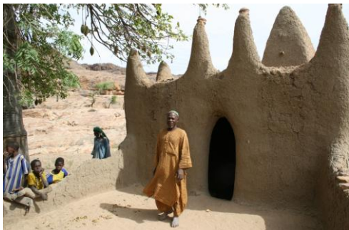
Рис. 17. Старая мечеть в деревне Кани-Бонзон (Кани-На) 1

Планировка этих сооружений может варьироваться в широких пределах: двор может быть больше или меньше, на крышу может вести лестница в башне, подобная башенной лестнице в Дженне, но она может быть и приставной. Единственное, что объединяет все эти мечети – богатый декор, полностью отсутствующий в сооружениях, построенных во время первой волны исламизации.