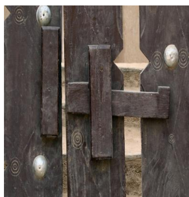
Рис. 12. Засов на воротах мечети в Дженне 5