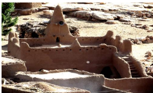
Рис. 22. Мечеть в деревне Тинтан 3

на она на одну семью, и даже ближайшие соседи туда не ходят. Объясняется это тем, что семья поселилась в чужом квартале, а ходить в мечеть своего квартала им далеко. В соседней с Энде деревеньке Багуру (административно она является частью Энде) два квартала, и оба имеют свои мечети, которые похожи друг на друга, как близнецы. Обилие в Энде небольших мечетей объясняется своеобразием внутривосстановленных отношений: в деревне нет вождя, и все решения принимаются на уровне квартала, причём отношения между ними совсем не простые: в деревне существуют, по меньшей мере, две устные традиции об истории её основания. От того, кто был основателем деревни, зависят права на владение землёй. Потомки основателя имеют в этом вопросе преимущество. Схожими причинами объясняется и обилие мечетей в д. Кани-Бонзон. В отличие от большинства деревень догонов, имеющих четыре-пять кварталов, в Кани-Бонзон их восемнадцать (!), и разбросаны они по весьма обширной территории.