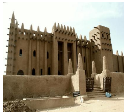
Рис. 2. Мечеть в Дженне, северный фасад 1

В том же убеждают старинные рисунки и фотографии городской застройки Дженне: можно констатировать, что сохранилась она практически в неприкосновенном виде. Теперь в Дженне даже совсем новые сооружения – жилые дома, административные здания, музеи и т. д. – строятся в традиционном (чаще всего Марокканском) стиле, причём на глаз невозможно определить, построен дом в XIX в. или уже в XXI. Именно поэтому заслуживает внимания планировка традиционных двухэтажных домов в Дженне. Скорее всего, она не подверглась существенным изменениям с момента основания города и может рассматриваться как черта старого Суданского стиля, который ещё не знал никаких внешних влияний.