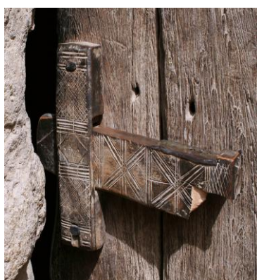
Рис. 11. Засов на двери дома в Дженне 4