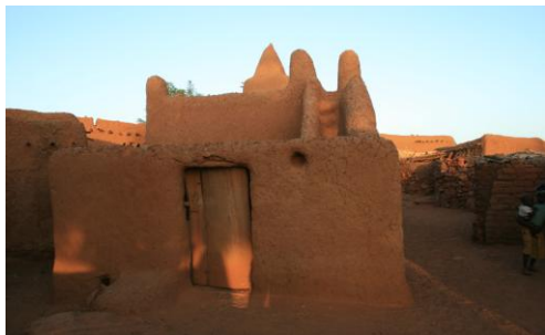
Рис. 20. Мечеть в д. Уме (квартал Тинтан). Справа видна характерная для северных мечетей лестница на крышу 1

метим, что появление такого засова, с точки зрения автора, способно пролить свет на загадку появления той же формы на фасадах мечетей в Дженне и Мопти.