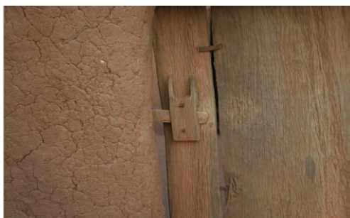
Рис. 21. Засов на воротах мечете в д. Уме 2

на она на одну семью, и даже ближайшие соседи туда не ходят. Объясняется это тем, что семья поселилась в чужом квартале, а ходить в мечеть своего квартала им далеко. В соседней с Энде деревеньке Багуру (административно она является частью Энде) два квартала, и оба имеют свои мечети, которые похожи друг на друга, как близнецы. Обилие в Энде небольших мечетей объясняется своеобразием внутривосстановленных отношений: в деревне нет вождя, и все решения принимаются на уровне квартала, причём отношения между ними совсем не простые: в деревне существуют, по меньшей мере, две устные традиции об истории её основания. От того, кто был основателем деревни, зависят права на владение землёй. Потомки основателя имеют в этом вопросе преимущество. Схожими причинами объясняется и обилие мечетей в д. Кани-Бонзон. В отличие от большинства деревень догонов, имеющих четыре-пять кварталов, в Кани-Бонзон их восемнадцать (!), и разбросаны они по весьма обширной территории.