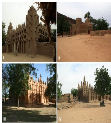
Рис. 23. Мечети второй группы (нач. XXI в.): I – д. Энде; II – д. Кани Комболе; III – д. Догани; IV – д. Кани-Бонзон (Кани На) 1

Сейчас в Энде достигнут баланс интересов. Для того чтобы сохранить его, жители деревни стараются ни в коем случае не вмешиваться в дела соседних кварталов и всеми силами избегают действий, которые могли бы дать повод обвинить их в покушении на чу-