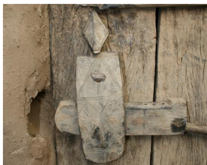
Рис. 13. Антропоморфный засов из деревни Энде, юг Плато Догон 1

Из тех групп, что составляют современных догонов, первыми на западе Плато появились люди из народа сонинке, которых в нескольких деревнях на севере Страны догонов до сих пор именуют «дженненке» [3, с. 64] («люди Дженне», т. е. выходцы с территории, контролируемой Дженне). Начиная с XV в. они начали продвигаться на северо-восток, вероятно, под давлением пришельцев из «Страны манде» и осели в областях Нижнее Геу и Бондум, расположенной чуть восточнее Геу.