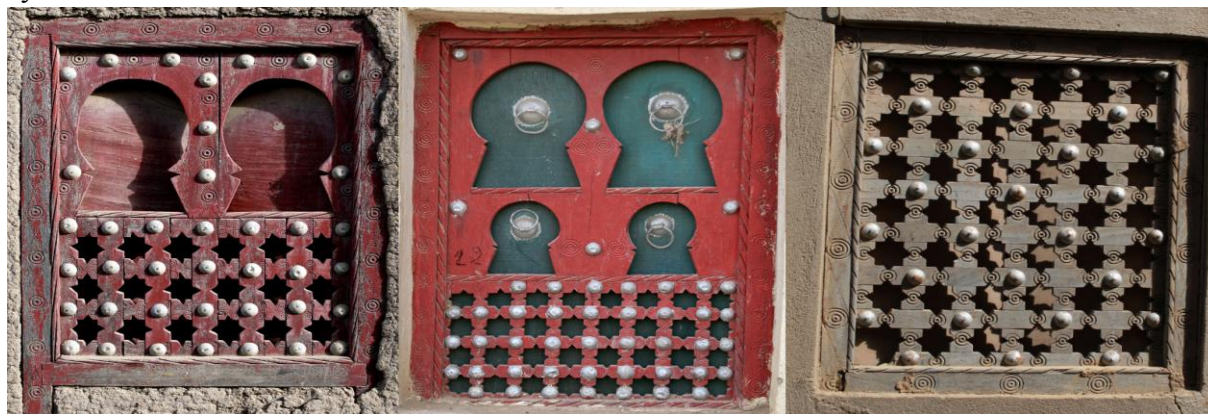
Рис. 7. Окна Дженне в Марокканском стиле 2

В Дженне есть гробница девушки по имени Тапама Дьенепе, которую в IX в. при основании города принесли в жертву, дабы защитить тот от злых духов. Её гробница в архитектурном отношении ничем не отличается от гробниц мусульманских святых возле мечети, да и местное население не видит особой разницы между ними и девушкой, погибшей в результате языческого жертвоприношения и, разумеется, не бывшей мусульманкой.