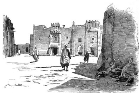
Рис. 5. Площадь в квартале Бамбана Алгасба с рис. 4 на иллюстрации из книги Ф. Дюбуа, изданной в 1896 г. [7, с. 92] 2

Есть ещё одно свидетельство в пользу того, что Суданский стиль, подразделяющийся на Марокканский стиль и Стиль тукулеров, возник именно на местной, малийской почве. Как видно на рис. 1, фасады домов Суданского стиля обладают интереснейшей чертой: они антропоморфны. Порталы же мечетей в Дженне и Мопти и вообще зооантропоморфны, поскольку воспроизводят основную композиционную схему масок догонов, обнаруживая явное сходство с маской антилопы-Валу 3 , что ещё в 1971 г. отметил британский исследователь Фрэнк Уиллетт [20, с. 124]. Любопытно, что именно в жилых домах, построенных в Стиле тукулеров (в определённом смысле их даже можно считать предтечами радикального ислама), антропоморфизм архитектуры доводится подчас до высшей черты (рис. 8).