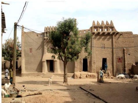
Рис. 4. Фасады в Стиле тукулеров (слева) и Марокканском стиле (справа) на площади в квартале Бамбана Алгасба 1

чертах сложился уже к XIII в., ко времени постройки первой мечети в Дженне, и очень возможно, что именно тот, первоначальный стиль и сохранился в облике современной мечети.