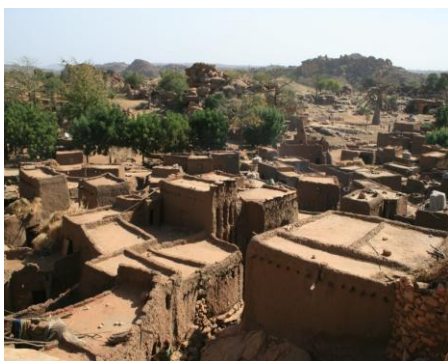
Рис. 14. Двухэтажный дом (в центре) в деревне Тинтан (Тинтам) 2

Связь с городами Внутренней дельты Нигера (по преимуществу Дженне) проявляется и в изобразительном, и в прикладном искусстве, и в архитектуре. Сходство между терракотовой скульптурой Внутренней дельты IX–XIII вв. и деревянной скульптурой догонов ещё в 1988 г. убедительно продемонстрировал Бернар де Грюнн в статье, посвящённой этому вопросу [11, с. 50–55]. Заметим, что скульптура Дженне и Внутренней Дельты датируется временем, предшествующим появлению первых групп пришельцев из «Страны манде» на юге Плато и в скалах Бандиагара (конец XV – начало XVI в.). Что касается декоративно-прикладного искусства, то и в деревне Тинтан (Тинтам), и в Дженне бытуют дверные засовы одного и того же типа (рис. 10, 11, 12),