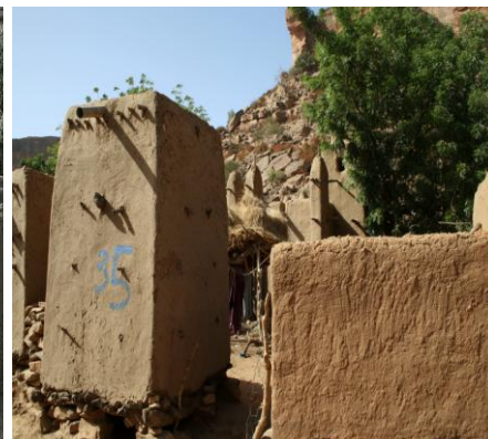
Рис. 25. Семейная мечеть в д. Энде (в глубине двора) 3