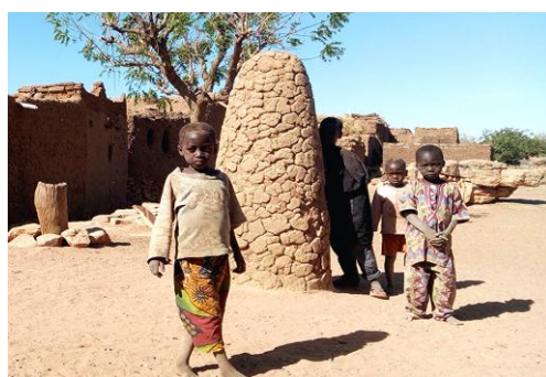
Рис. 19. Дети рядом с алтарём Ама (деревня Семари) 3

также типично для архитектуры догонов, причём особенно для северных деревень. Этот декор представляет собой ниши, которые под ярким солнцем Мали создают резкий контраст между затенёнными и освещёнными участками стены. Такие ниши традиционны для архитектуры догонов в целом, но весьма разнообразны – они могут быть глубокими и едва намеченными, большими и маленькими, квадратными и вытянутыми по вертикали или горизонтали и т. д. В том, что этот элемент декора характерен именно для архитектуры догонов, убеждает уже упоминавшийся выше дворец Агибу Талля в г. Бандиagara.