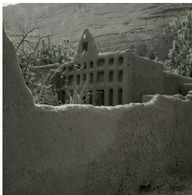
Рис. 24. Дом в д. Энде, декорированный нишами 2