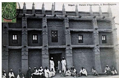
Рис. 16. Дворец Агибу Талля на французской почтовой открытке нач. XX в. (ок. 1905 г.) http://www.dogon-lobi.ch/cartes056.htm 1

Мечети, связанные со второй волной исламизации региона и датируемые концом XX – нач. XXI в., сильно отличаются от памятников первой группы – они, как правило, значительно больше (рис. 23).