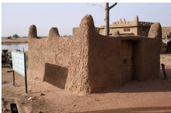
Рис. 9. Гробница Тапама Дженепо 2