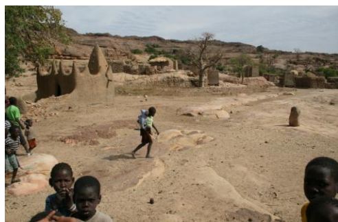
Рис. 18. Площадь около старой мечети в деревне Кани-Бонзон (Кани-На) с алтарём Ама (справа) 2

Он был бы точной копией типичного для Дженне дома, построенного в Марокканском стиле с характерными окнами, если бы пилястры не были дополнены горизонтальным членением. Судя по старой открытке, первоначально фасад был ассиметричным, что