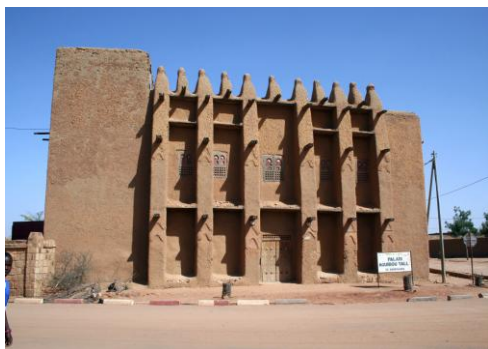
Рис. 15. Дворец Агибу Талля, г. Бандиагара, Республика Мали (1894) 2

Всё это имеет самое прямое отношение и к мусульманской архитектуре, но тут общность между югом и севером всё же сильнее, чем различия. И на севере, и на юге