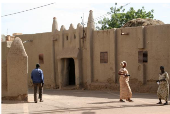
Рис. 8. Фасад жилого дома в Стиле тукулеров в Мопти (напротив северного фасада мечети) 1

Прежде чем непосредственно обратиться к архитектуре, отметим немаловажную деталь, касающуюся этнографии догонов: это вовсе не единый народ. Догоны состоят из четырёх племён и говорят на пяти разных языках. Формировались они из групп самого разного происхождения, пришедших на Плато Догон разными путями и в разное время. Даже в одной деревне может быть несколько исторических преданий относительно её основания, и все они будут соответствовать действительности – разнообразие традиций является свидетельством того, что разные группы основали свои поселения в данном месте независимо друг от друга, и только спустя какое-то время эти поселения слились в одну деревню.