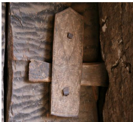
Рис. 10 Засов из деревни Тинтан (Тинтам), север Плато Догон 3