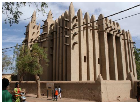
Рис. 3. Мечеть в Мопти, северный фасад 2

Другой не менее выдающийся памятник – мечеть в г. Мопти, основанном французами порте при слиянии Бани и Нигера (центральная часть города построена в Стиле тукулеров и Марокканском стиле, что и Дженне). Она была построена примерно на 30 лет позже мечети в Дженне. В отличие от последней в мечети Мопти нет большого двора. Объясняется это тем, что в Мопти мечеть была «встроена» в плотную городскую застройку, а аналогичное сооружение в Дженне расположено на просторной рыночной площади. К сожалению, неизвестны имена архитекторов обеих построек. Это